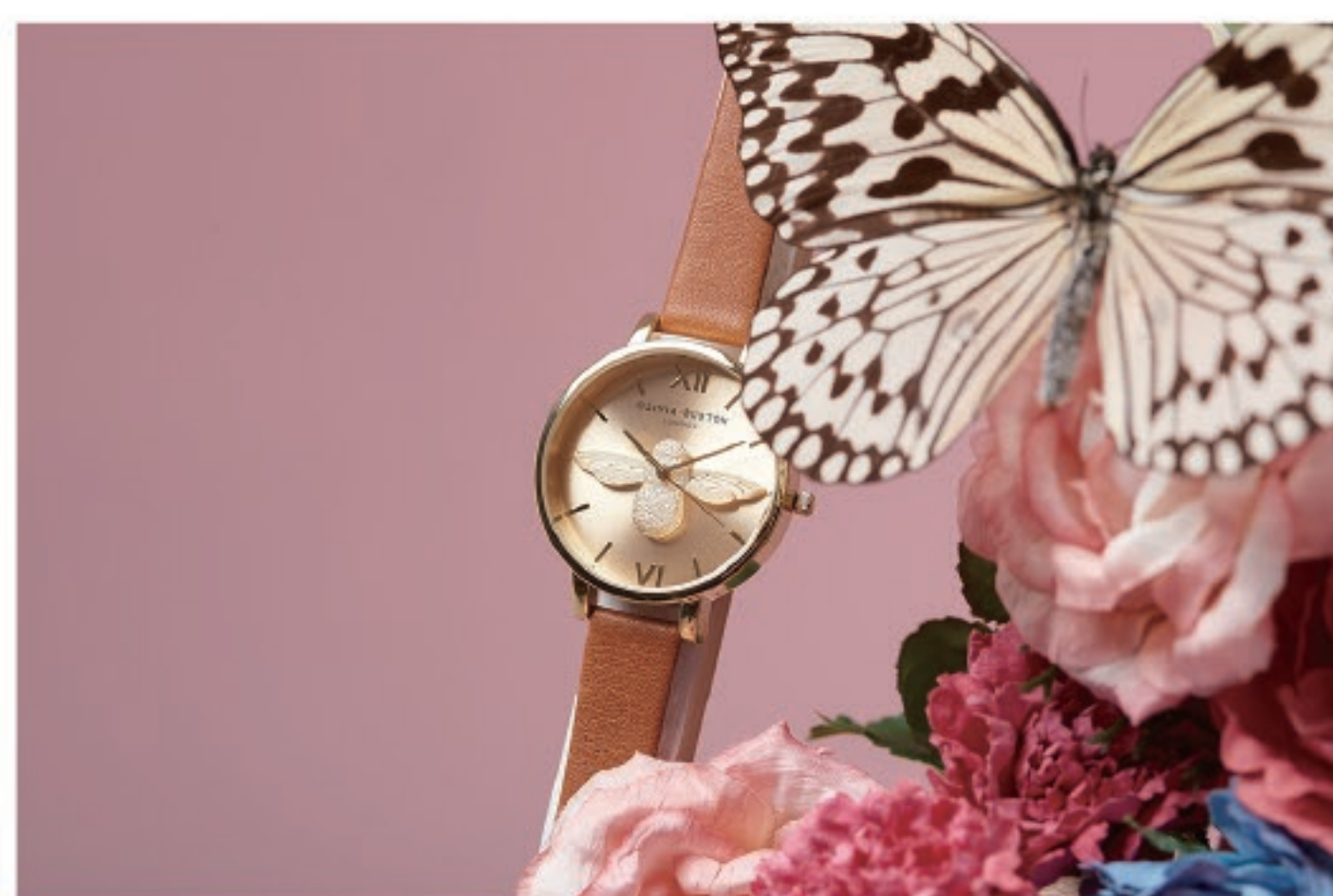
OLIVIA BURTON LONDON